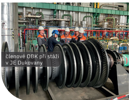
členové OBK při stáži v JE Dukovany

Občanská bezpečnostní komise při Jaderné elektrárně Dukovany (OBK) vznikla v roce 1996 na základě dohody mezi Jadernou elektrárnou Dukovany a okolními obcemi. Motivem pro vznik Občanské bezpečnostní komise byla snaha o posílení vzájemné důvěry mezi občany a elektrárnou. Hlavním úkolem komise je provádění nezávislé občanské kontroly provozu jaderných zařízení, jejich srovnání s odpovídající mezinárodní praxí a informování veřejnosti o těchto poznatcích. Zajímá se i o energetickou budoucnost lokality a úzce spolupracuje s některými jadernými sdruženími doma i v zahraničí. Členové jsou delegováni sdružením Energoregion 2020, Ekoregion 5 a obcemi Dukovany a Rouchovany. Tým OBK je doplněn specialisty z Jaderné elektrárny Dukovany a zástupcem Správy úložiště radioaktivních odpadů (SÚRAO). Specializují se na různé obory činností, podle nich jsou rozděleni do sedmi oblastí, ve kterých se dále vzdělávají a školí. Všichni splňují podmínky pro samostatný vstup do střeženého areálu JE Dukovany.