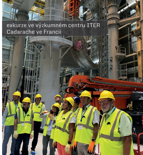
exkurze ve výzkumném centru ITER Cadarache ve Francii

O provozu JE Dukovany a celkové situaci v jaderné energetice OBK pravidelně informuje nejen starosty obcí v regionu JE Dukovany, ale i ostatní veřejnost prostřednictvím svých webových stránek www.obkjedu.cz