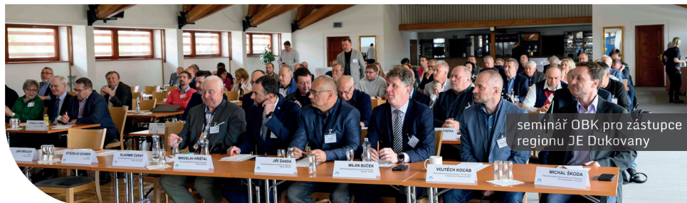
seminář OBK pro zástupce regionu JE Dukovany