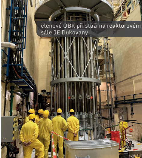
členové OBK při stáži na reaktorovém sále JE Dukovany